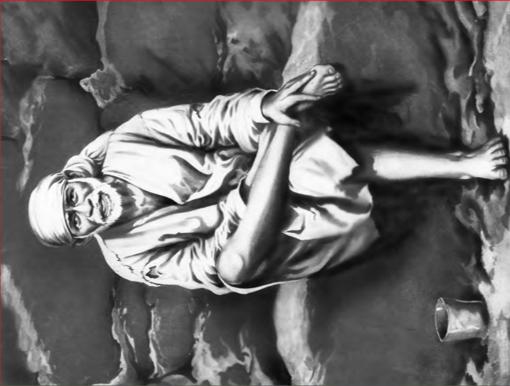
પૂજ્ય શ્રી સાઈબાબા (શિરડી - મહારાષ્ટ્ર)