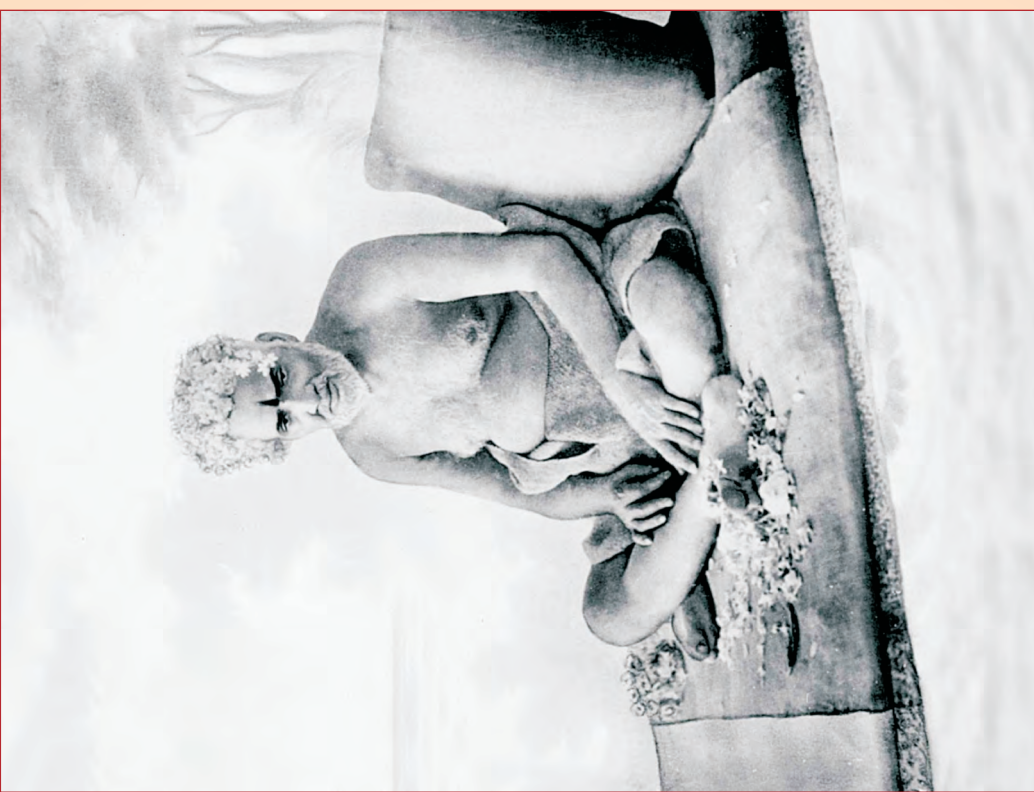
પૂજ્ય શ્રી ઉપાસની મહારાજ (સાકોશી - શિરડી પાસે, મહારાષ્ટ્ર)